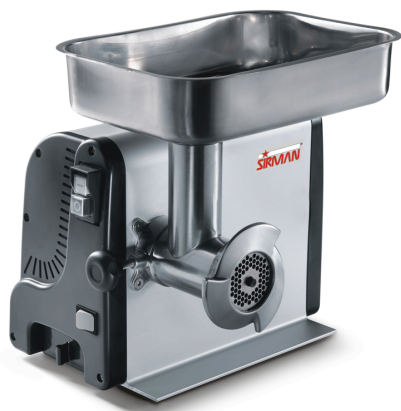
Sirman Мясорубки , model TC 8 Vegas :