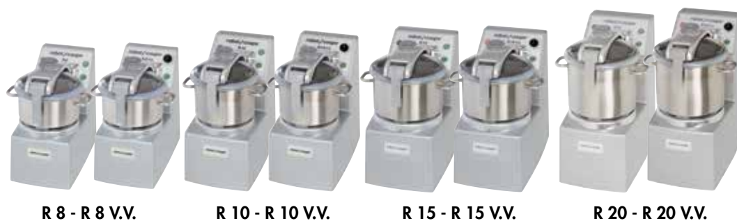
R 8 - R 8 V.V.